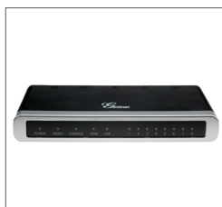
Adaptador telefónico de ACN

Revise los artículos incluidos en el kit de su adaptador telefónico.