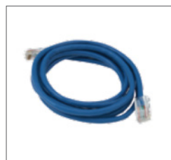
Cable de Ethernet