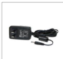
Adaptador de corriente